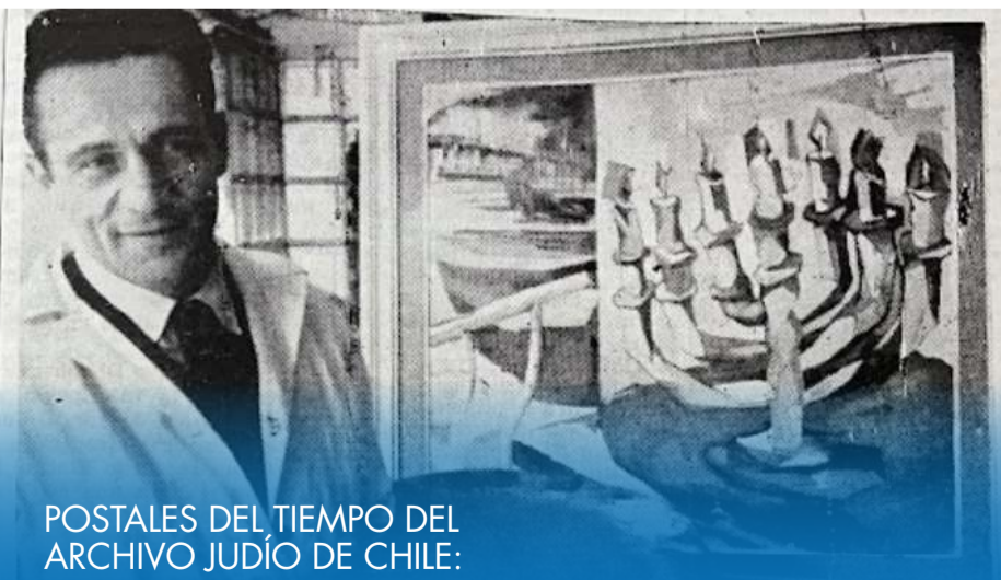
POSTALES DEL TIEMPO DEL ARCHIVO JUDÍO DE CHILE: