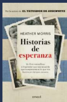
Historias de esperanza Heather Morris

H istorias de esperanza es su compañero esencial y en él Heather Morris nos ofrece un manual inspirador para nuestra vida, con emocionantes relatos de la gente que ha conocido, las increíbles historias que han compartido con la autora y las lecciones que nos enseñan a todos. Morris explora su extraordinario talento como oyente, una habilidad que empleó cuando conoció a Lale Sokolov, el tatuador de Auschwitz-Birkenau y la inspiración para su novela más celebrada. La autora comparte la historia detrás de su viaje como escritora y las experiencias de su vida, incluida su profunda amistad con Lale, y explora cómo aprendió a escuchar las historias que le contaban las personas que se acercaron a ella, unas habilidades que considera esenciales y que cree que todos podemos, y deberíamos, aprender.