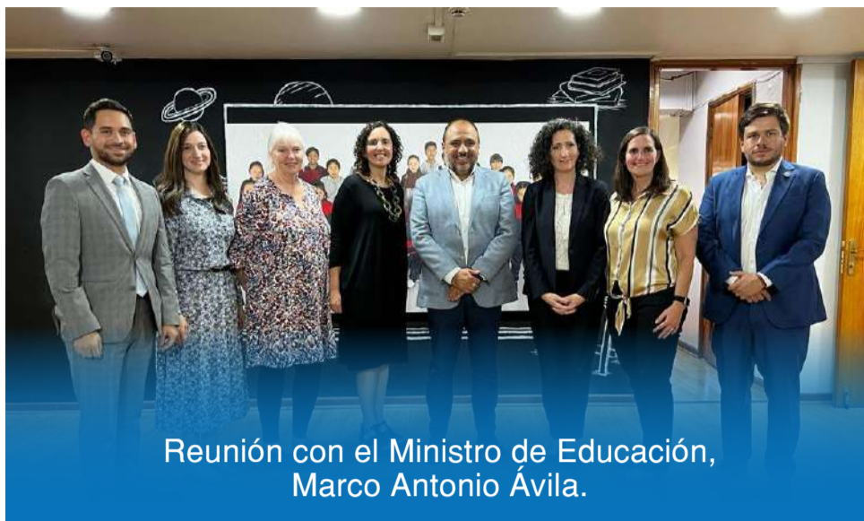
Reunión con el Ministro de Educación, Marco Antonio Ávila.

-Bueno, la excusa para venir acá a Chile fue un acuerdo que firmamos con el Museo Judío, con el apoyo de las CJCh, para ampliar nuestra colaboración en temas de programas educativos. Específicamente, vamos a lanzar un programa especial que se llama "COAJ, Combatiendo Odio y Antisemitismo Juntas y Juntos". En las últimas semanas también se tradujeron al español materiales educativos para estudiantes de judíos, "Words to action" y otros más. Entonces, la idea es que, junto con el Museo Judío y con el apoyo y la colaboración de la CJCh y de otras instituciones comunitarias, podamos aumentar el número de programas educativos y llegar a más colegios, a más estudiantes universitarios, y educar sobre no discriminación y discursos de odio. En ese contexto, también nos encontramos con el Ministro de Educación, Marco Antonio Ávila, para presentarle estos proyectos y ver cómo el ministerio puede ayudar para, de una manera más sistemática, llegar a más colegios a largo del país.