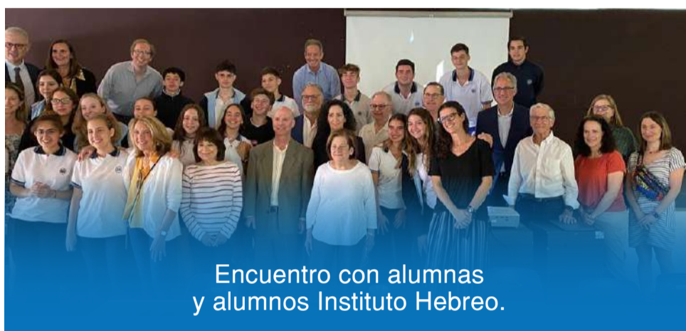
Encuentro con alumnas y alumnos Instituto Hebreo.