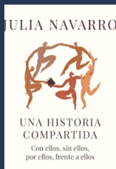
Una historia compartida

H istorias de esperanza es su compañero esencial y en él Heather Morris nos ofrece un manual inspirador para nuestra vida, con emocionantes relatos de la gente que ha conocido, las increíbles historias que han compartido con la autora y las lecciones que nos enseñan a todos. Morris explora su extraordinario talento como oyente, una habilidad que empleó cuando conoció a Lale Sokolov, el tatuador de Auschwitz-Birkenau y la inspiración para su novela más celebrada. La autora comparte la historia detrás de su viaje como escritora y las experiencias de su vida, incluida su profunda amistad con Lale, y explora cómo aprendió a escuchar las historias que le contaban las personas que se acercaron a ella, unas habilidades que considera esenciales y que cree que todos podemos, y deberíamos, aprender.