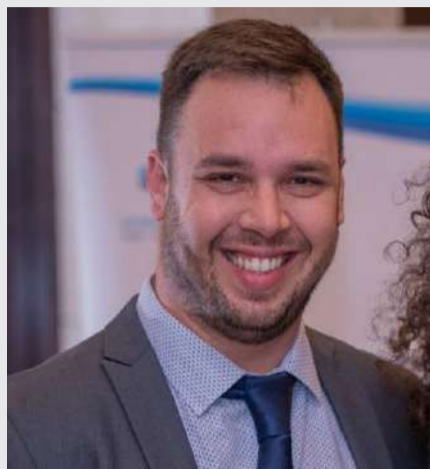
Por: Roberto Avram sheliaj de Keren Hayesod Chile

Para realizar un aporte al Estado de Israel durante sus 75° Aniversario, comunícate con info@khchile.cl o visita en nuestra página web www.khchile.cl .