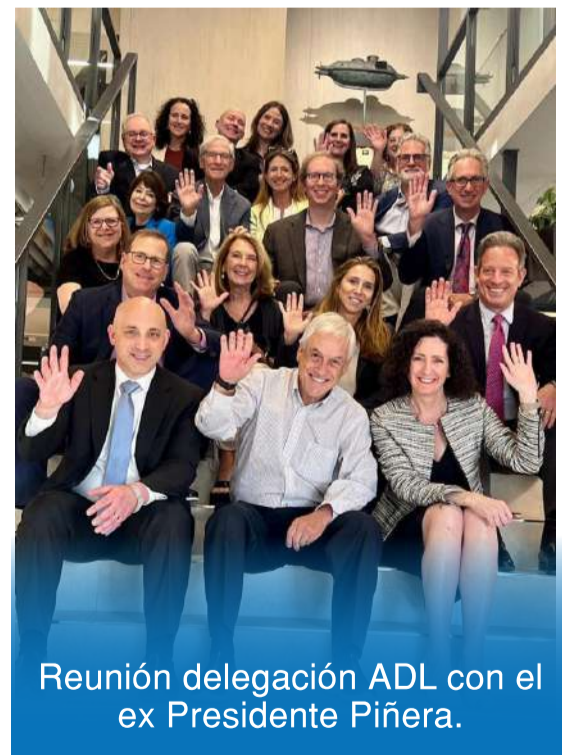
Reunión delegación ADL con el ex Presidente Piñera.

En consecuencia, ADL se enfoca en investigación, en la realización de auditorías para tener la datos fidedignos y, con esta información, poder tomar en la lucha contra el extremismo en todas sus formas. Tenemos un centro sobre extremismo en Nueva York, que estudia desde los supremacistas blancos a extremistas de izquierda radical anti sionista, así como a radicales islamistas, y esto en cooperación con el FBI y las policías locales en Estados Unidos. De la misma forma, nos enfocamos en el área de educación, con una amplia diversidad en su programación, desde programas para niños judíos en escuelas secundarias sobre cómo enfrentar el antisemitismo a programas para jóvenes no judíos, con el objetivo de educarlos sobre quiénes somos los judíos, que significa el tema de la discriminación, la memoria del Holocausto, etc. Después tenemos programas